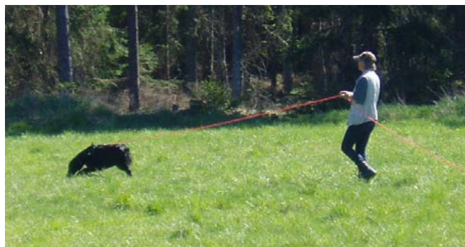
Ingela och Jazz i på spårövning under vårens Aktiviseringskurs.