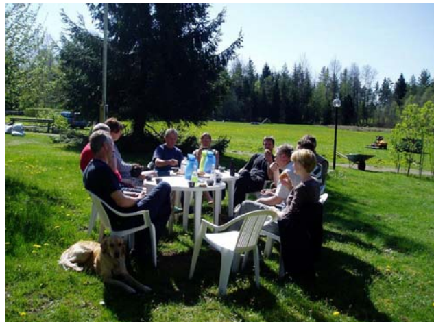
En välbehövlig korvpaus under vårstädningen den 5 maj!

Utesektorn gör varje år ett jättejobb med klubbens utemiljö. Det största arbetet består ju av gräsklippning, men vi behöver också hjälp med att hålla miljön runt stugan allmänt fräsch, snygg och välkomnande.